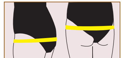
Hüftweite Maßband glatt waagrecht über die stärkste Stelle des Gesäßes (je nach Figur unterschiedlich hoch) legen und fixieren.